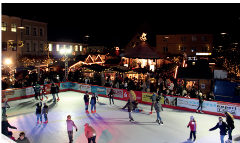
► Weihnachtsmarkt in der unteren Altstadt mit der Neuburger „EisArena“

Vor allem das Flair der Renaissancestadt Neuburg ist EINDRUCKSVOLL . Das historische Altstadt-Ensemble mit dem Karlsplatz und dem Renaissanceschloss bildet eine perfekte Bühne für verschiedenste kulturelle Aktivitäten. Das historische Schloßfest mit über 100.000 Besuchern, die weithin bekannte Sommerakademie mit internationalen Dozenten, das Neuburger Stadttheater, die Barockkonzerte, der Birdland Jazzclub und die weltweit größte Hutmodenschau sind Beispiele aus dem umfangreichen Angebot der Kultur- und Erlebnisstadt NEUBURG AN DER DONAU .