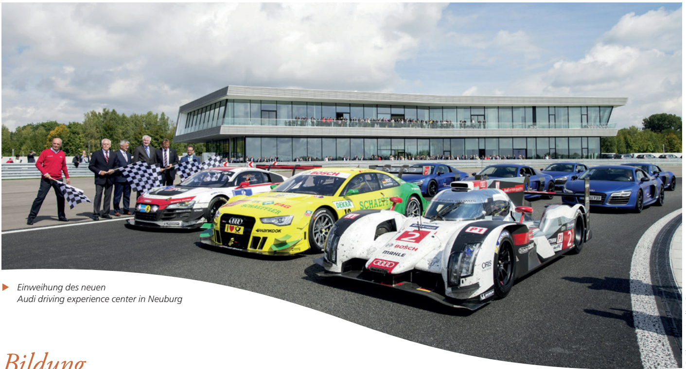
► Einweihung des neuen Audi driving experience center in Neuburg