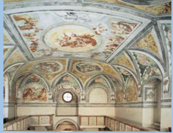
Die Schloßkapelle mit ihren Bocksberger-Fresken

Bedeutende Anlage der Frührenaissance, 1530-45 von Pfalzgraf Ottheinrich erbaut; Schlosskapelle , ältester protestantischer Kirchenbau Bayerns mit Fresken von Hans Bocksberger (1543); im Schlosshof Sgraffitifassade mit Szenen aus dem Alte Testament von Hans Schroer (nach 1555); monumentaler Ostflügel mit zwei Rundtürmen, von denen der nördliche im Erdgeschoss eine barocke