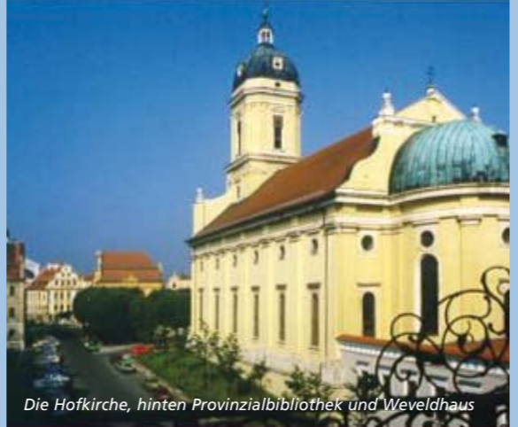
Die Hofkirche, hinten Provinzialbibliothek und Weveldhaus

Barockbau von 1713. Im Obergeschoss Saal der ehem. Studentenkongregation mit Deckenstuck und Gemälden des Neuburger Hofmalers Franz Hagen, heute städt. Konzertsaal; Stätte der Barockkonzerte .