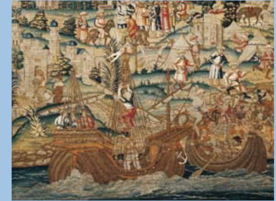
Ausschnitt Gobelin aus dem Schlossmuseum

Ehem. Eckbastion der Neuburger Stadtmauer aus dem 15. Jahrhundert, ab ca. 1800 als Aussichtsturm im Hofgarten der Herzogin Amalie verwendet; 1928 Anbau und Nutzung als Kneippkurheim; nach der Renovierung 1990/92 als Tagungsräume genutzt (Vermietung möglich!).