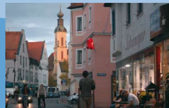
Hinter der Pfarrkirche Hlg. Geist läuft der Sternschanzenweg

Der am Südufer der Donau gelegene „Englische Garten“ wurde ab 1805 als Park angelegt und 1835 nach einem Gutachten Carl August Skells, Schöpfer des Englischen Gartens in München, erweitert. Heute ist er mit dem Donauauwald ein Spaziergängerparadies. Nahe des Donaukais finden wir die Bootslandestelle und einen Campingplatz für Wasserwanderer.