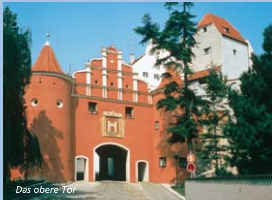
Das obere Tor

Erbaut durch die Stadt 1530; am Giebel das Neuburger Stadtwappen mit den Prinzen Ottheinrich und Philipp auf Steckenpferden.