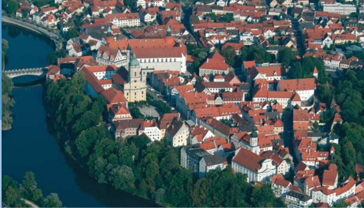
Die Neuburger Altstadt ist eines der schönsten und monumentalsten Altstadtensembles Bayerns und hat sich wunderbarerweise fast geschlossen durch die Kriege und Katastrophen vergangener Zeiten unversehrt erhalten. Unser kleiner Führer soll Ihnen helfen, die Schönheiten der Stadt zu erwandern und zu würdigen.