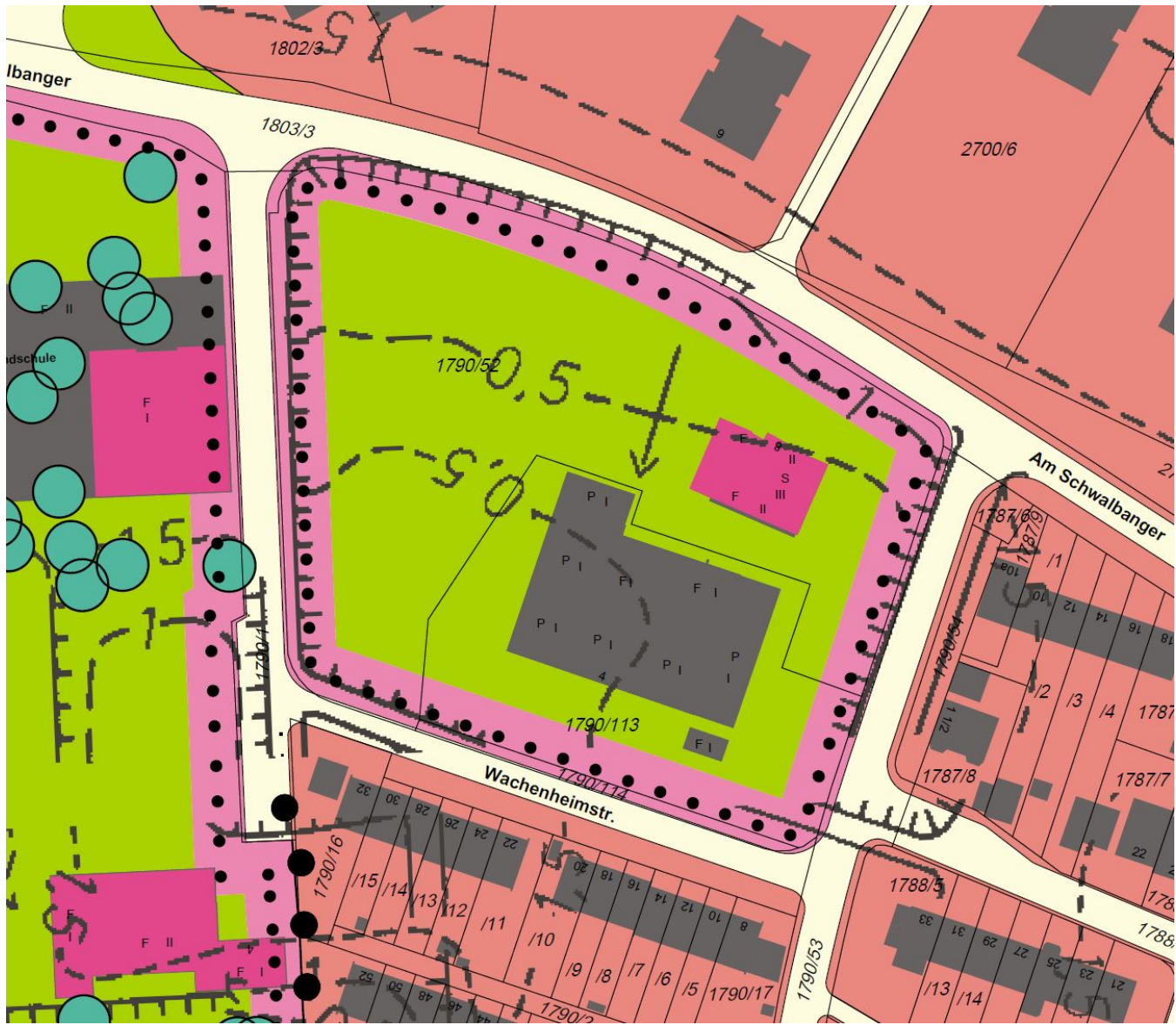
Auszug aus dem aktuell rechtsverbindlichen Flächennutzungsplan

Im momentan rechtsverbindlichen Flächennutzungsplan ist das Planungsgebiet als Flächen für den Gemeinbedarf dargestellt. Dies bleibt durch die Bebauungsplanänderung so bestehen.