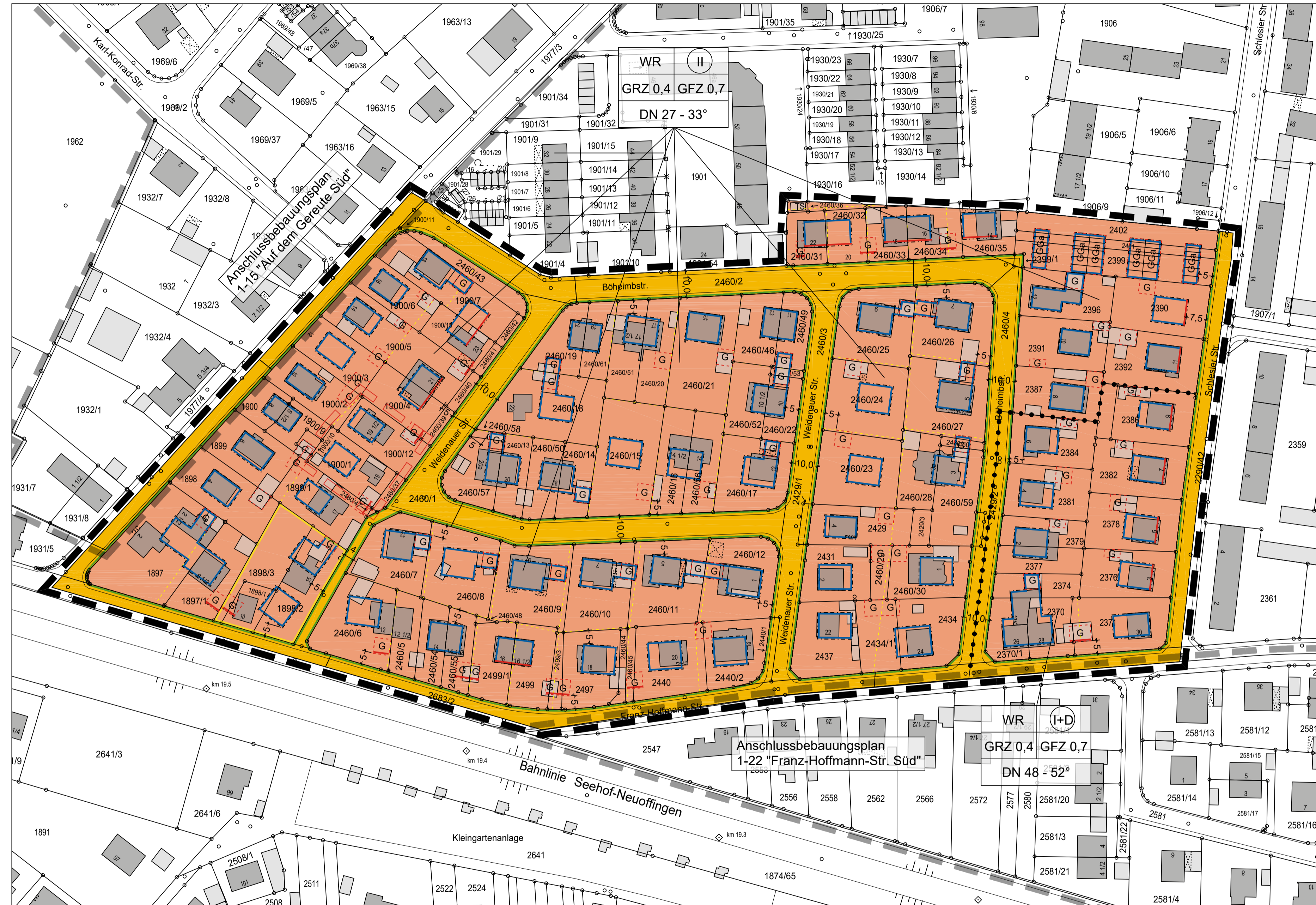
Bebauungsplan Nr. 1.21 "Franz-Hoffmann-Str. Nord"

Augsburg, den 27. Mai 1968 Regierung v. Schwaben I.A. gez. Sturm Regierungsbaudirektor