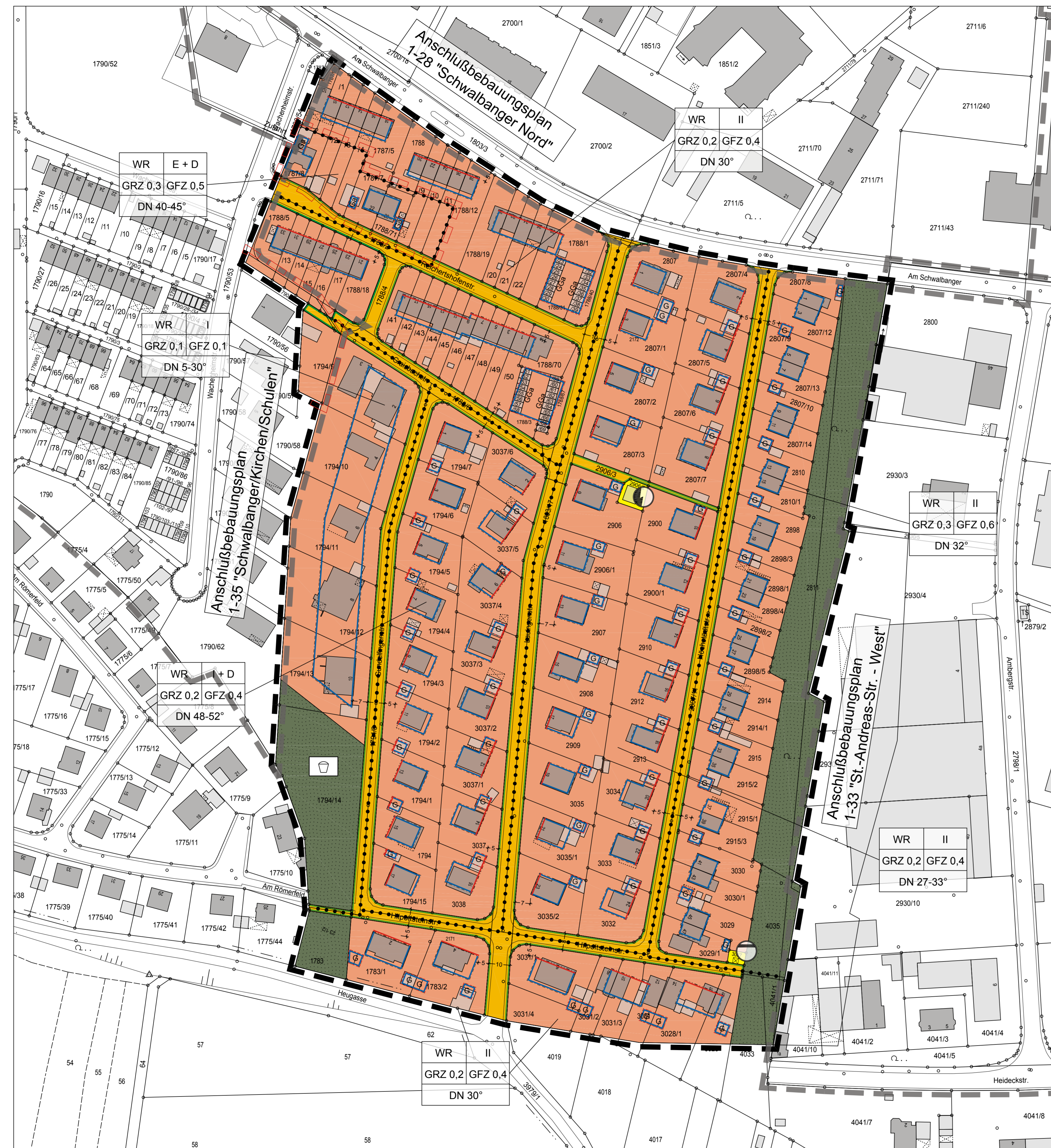
Bebauungsplan Nr. 1-34 "Schwalbanger Süd"