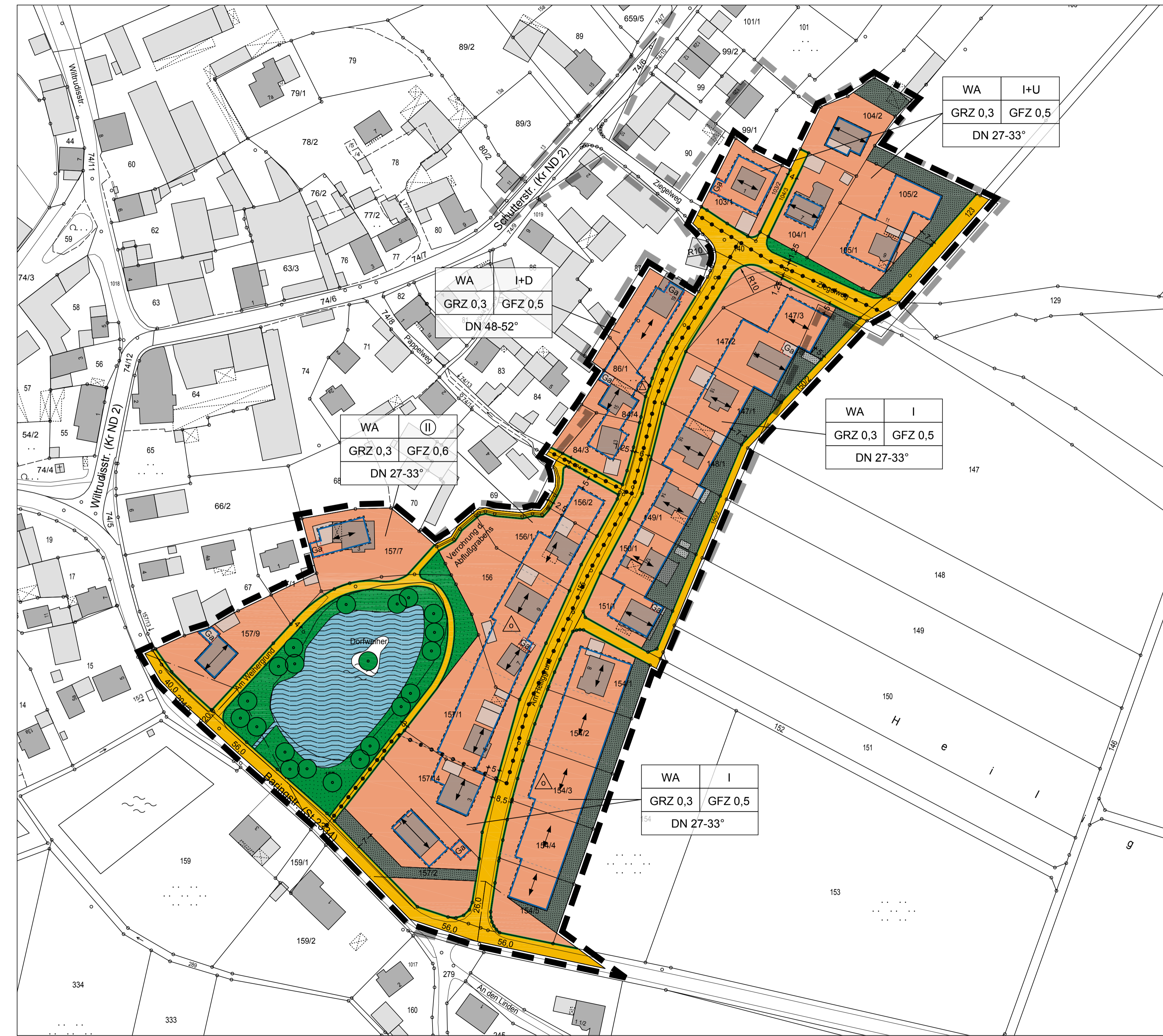
Bebauungsplan Nr. 2-05 "Am östlichen Dorfeingang"