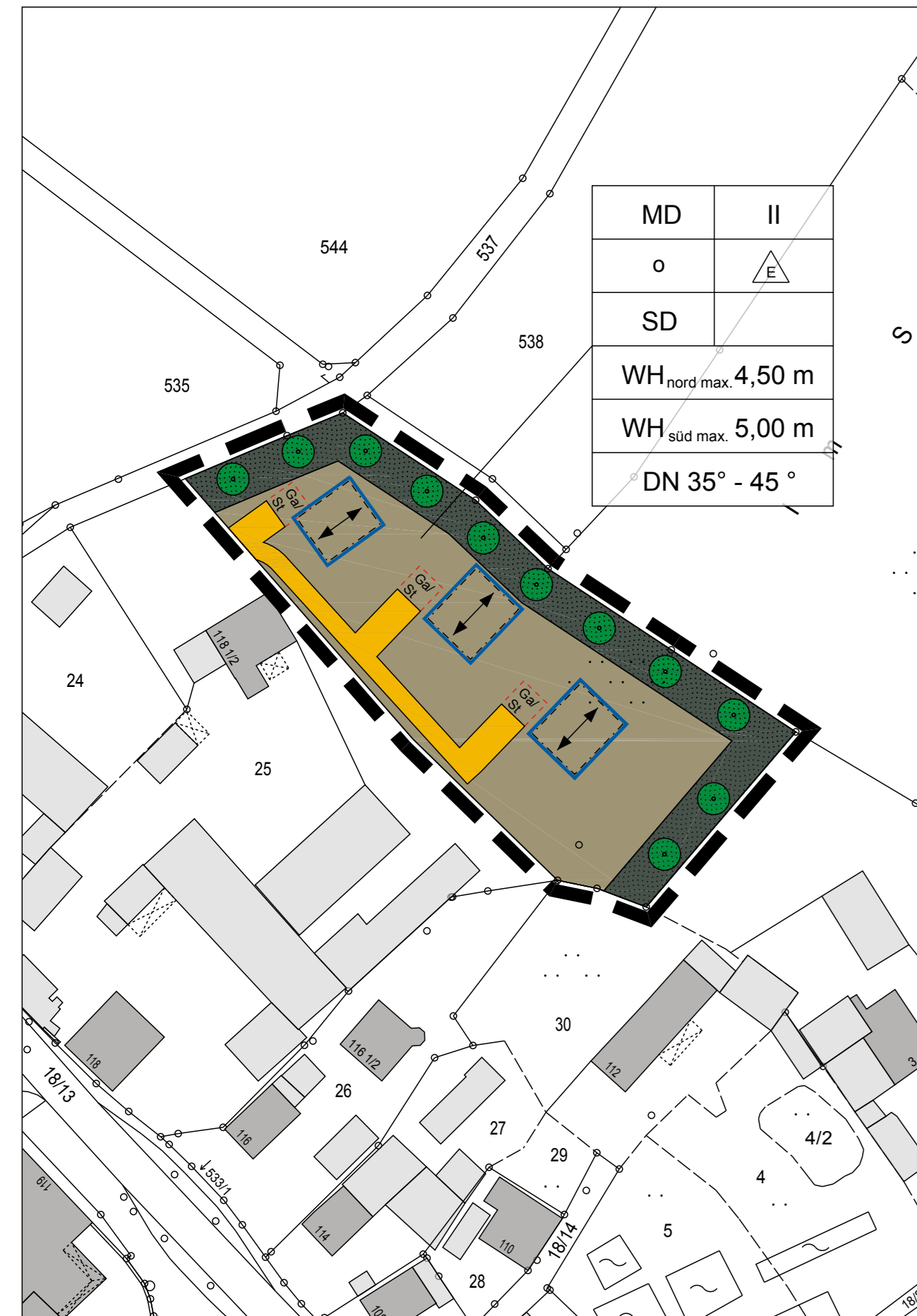
Einbeziehungs- und Ergänzungssatzung "Mohnheimer Straße" M 1 : 1.000