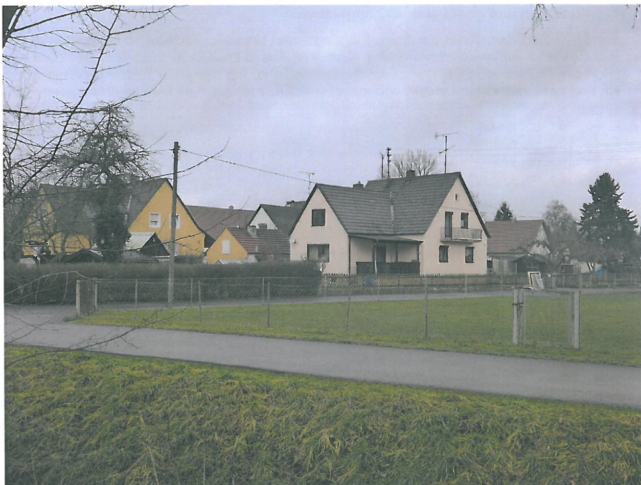
Bebauung westlich des Geltungsbereichs