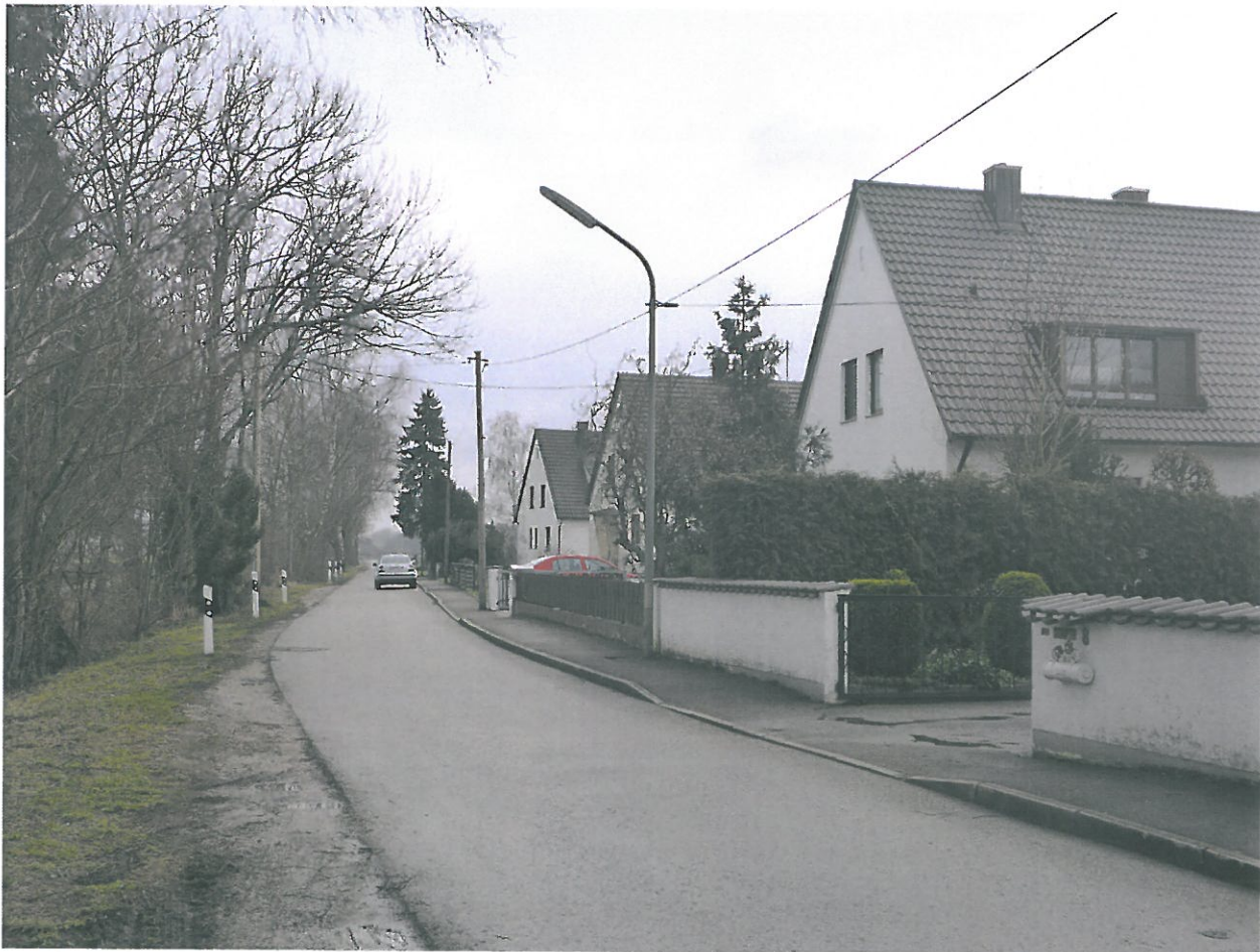
Bebauung südlich des Zeller Kanals / südlich des Geltungsbereichs

Obwohl es sich hier um Absiedlungsgebiet seit Ausweisung der alten Fluglärmschutzzonen (1975) handelt, sind offensichtlich fast keine Häuser aufgelassen worden. Die Gebäude sind in einem guten Erhaltungszustand. Es ist wohl langfristig hier mit keiner lärmbedingten Absiedlung zu rechnen.